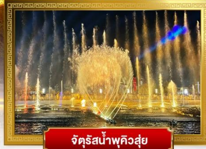
จัดรีสน้ำพุควิสู่