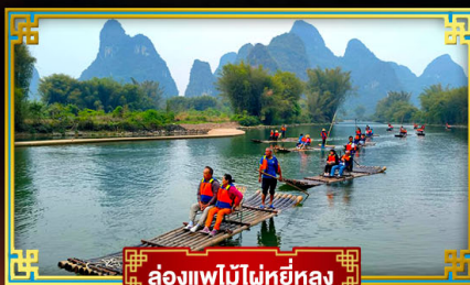
ล่องแพไม้ไผ่หยี่หลง