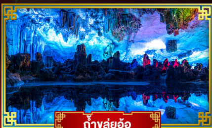
ถ้ำขลุ่ยอ้อ

"ดินแดนแห่งสายน้ำและขุนเขา" สัมผัสประสบการณ์นั่งบอลลูนชมวิวมุมสูง