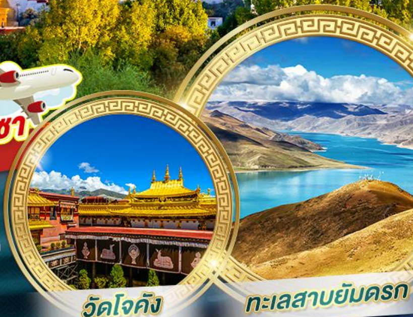
วัดใจคัง