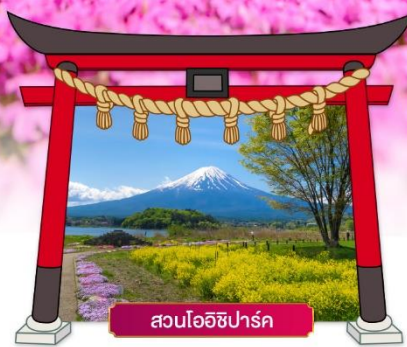
สวนโออิชิปาร์ค