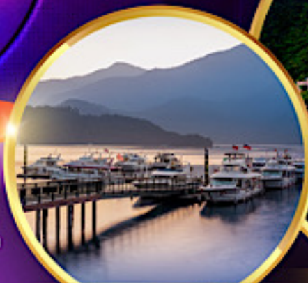
ล่องเรือทะเลสาบสุริยจันทร์