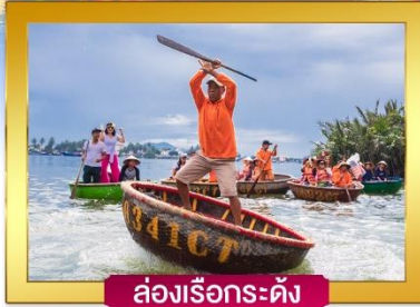
ล่องเรือกระทง