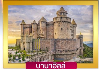
บานาฮิลล์