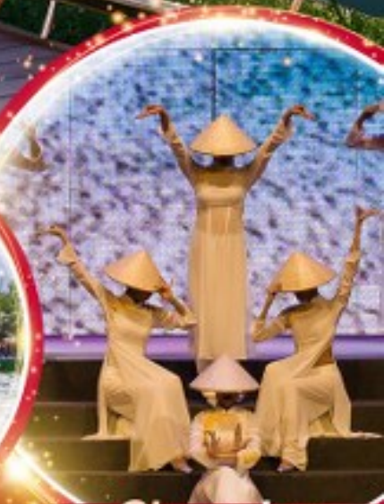
Charming Danang Show