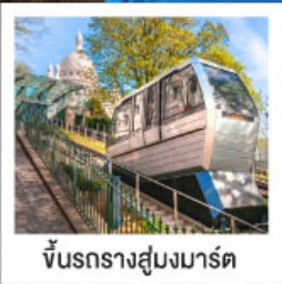
ขึ้นรางสุมมาร์ท