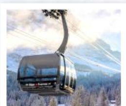
ขึ้นกระเช้ายอดเขาจุงเฟรา