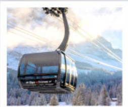
ขึ้นกระเช้ายอดเขาจุงเฟรา