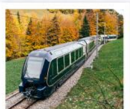
รถไฟโกลด์นพาส