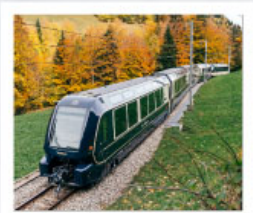
รถไฟโกลเด้นพาส