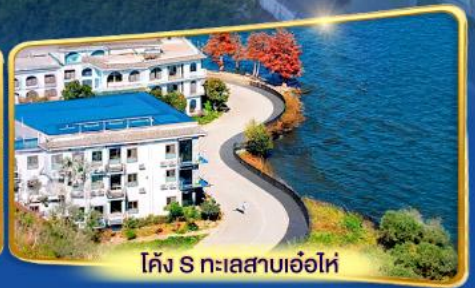
โค้ง S ทะเลสาบเอ๋อไห่