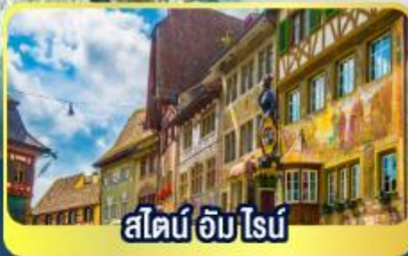
สไตน์ อัม ไรบ์