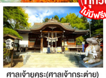
ศาลเจ้าคุระ (ศาลเจ้ากระต่าย)

พิเศษบุฟเฟ่ต์ชาบูสุดพรีเมียม ปูออกโทโด อาหารทะเล เนื้อวากิว สเต็ก ซูชิโอคุระ และเครื่องดื่มไม่อัน