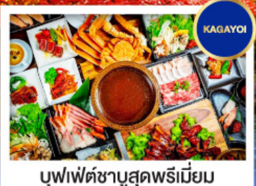
บุฟเฟ่ต์ชาบูสุดพรีเมียม