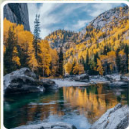
เคนเคอทัวให้อัจฉริยะภูผาหิน