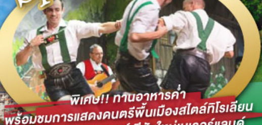
พิเศษ!! ทานอาหารค่ำ พร้อมชมการแสดงดนตรีพื้นเมืองสไตส์ทีโรเลียน และเยือนเมืองอูเทรคต์ สีสันใหม่เนเธอร์แลนด์

ไฮไลท์ในโปรแกรม • เยือนเมืองแห่งแคว้นบาวาเรีย และ ทีโรล • สุกสนานเหมืองเกลือเบิร์ชเทสกาเดิน • เข้าชมปราสาทนอยชวานสไตน์ • เดินเล่นจัตุรัสโรเมอร์ ซอปปิง Zeil Street • ถ่ายรูปมุมสวยของหมู่บ้านอัลสติก • ซิลลา ไปในเมืองซาลสบูร์ก บ้านเกิดโมสาร์ท • ล่องเรือหมู่บ้านทีธูร์น และ ล่องเรือชมนครอัมสเตอร์ดัม • ซอปปิงจุใจย่านดิมสแควร์และเดินเล่นย่านโคมแดง 25 ก.ย. - 04 ต.ค. 69 09-18, 16-25 ต.ค. 69 22-31 ต.ค. 69 / 06-15 พ.ย. 69 29 ธ.ค. 69 - 07 ม.ค. 70 * ปีใหม่ *