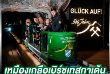
เหมืองเกลือเบิร์ชเทสกาเดิน