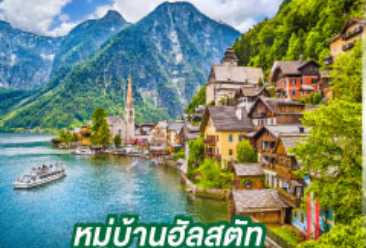
หมู่บ้านอัลสติก