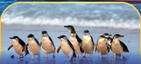
พาเหรดนกเพนกวิน