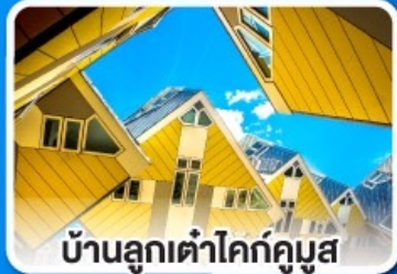
บ้านลูกเต่าโคกคูมูส