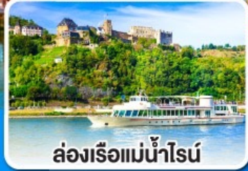
ล่องเรือแม่น้ำไรน์