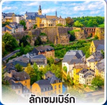
ลักเซมเบิร์ก

ล่องเรือ... ชมทัศนียภาพอันสวยงาม ตลอดสองฟากฝั่งของแม่น้ำไรน์