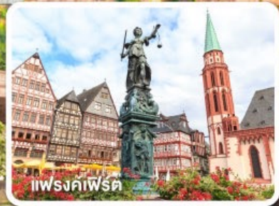
แฟรงค์เฟิร์ต

ฝรั่งเศส เบลเยียม ลักเซมเบิร์ก เยอรมนี เนเธอร์แลนด์ 8วัน 5คืน