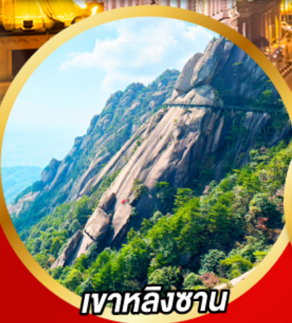
เวาหลิงซาน