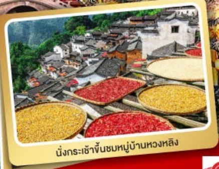
นั่งกระเช้าขึ้นชมหมู่บ้านหวงหลิง