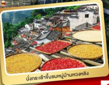
นั่งรถ-เข้าจันทรมหาหลิง