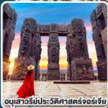
อนุสาวรีย์ประวัติศาสตร์จอร์เจีย

การ์นตี ห้องพักรีวิวเทือกเขาคอเคซัส ที่โรงแรม ROOMS