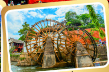
กังหันน้ำลี่เจียง