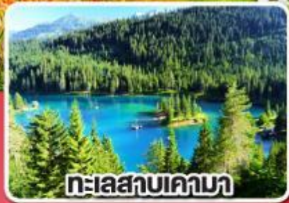
ทะเลสาบเคามา