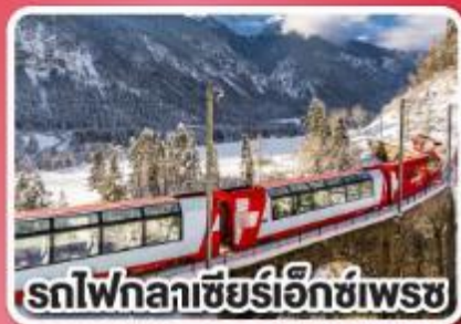
รถไฟกลาซีร์เอ็ทซ์เพรช