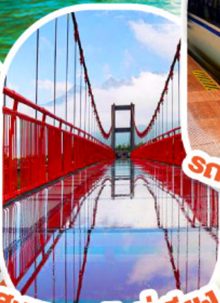
สะพานแก้วลี่เจียง