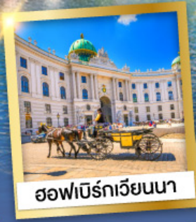
ออฟนิร์กเวียนนา