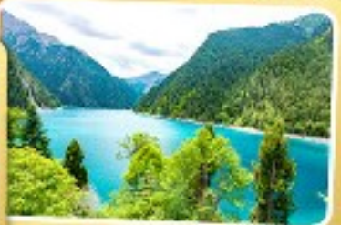
ทะเลสาบยาว