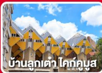
บ้านลูกเต่า โคทคูบุง