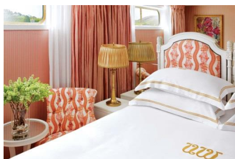
CLASSIC (CS) Luxurious riverview stateroom (15 SQ.M.)

**ราคาขึ้นอยู่กับจำนวนห้องพักที่เหลืออยู่และการขึ้นลงของค่าเงิน USD กรุณาสอบถามราคาอีกครั้งก่อนทำการจอง** บริษัท ควอลิตี้ เอ็กซ์เพรส จำกัด มีบริการซื้อตั๋วเครื่องบิน และ แผนกวีซ่า พร้อมบริการท่านแบบครบวงจร