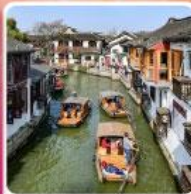
หมู่บ้านโบราณจูเจียเจียว + ล่องเรือ