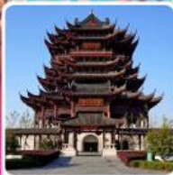
วัดหลงหยวน