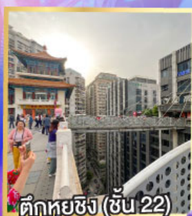
ตึกหุ่ยซิง (ชั้น 22)