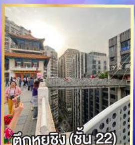
ตึกหุยซิง (ชั้น 22)