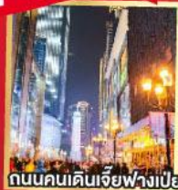
ถนนคนเดินเจียวฟางเป่ย์