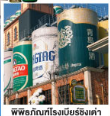
พรรกัณฑ์โรงเบียร์ชิงเต่า