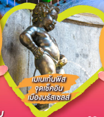
เมเนกันพิส จุดเช็คอิน เมืองบรัสเซลส์