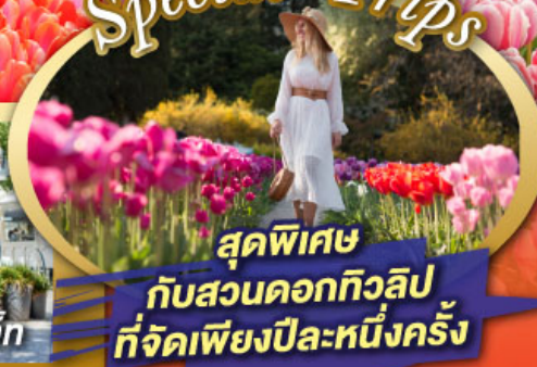
สุดพิเศษ กับสวนดอกทิวลิป ที่จัดเพียงปีละหนึ่งครั้ง