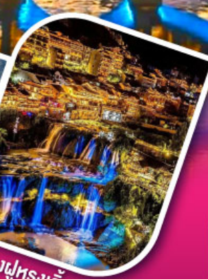
เมืองฟูหลงเจิ้น