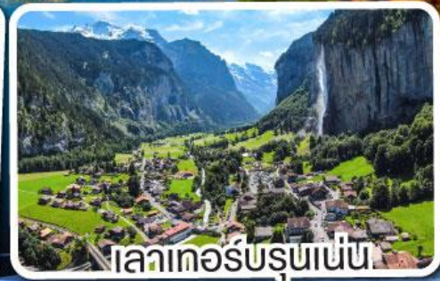
ลาเทอ์บรุนเนน