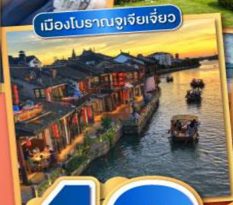
เมืองโบราณซูเจียวเจียว