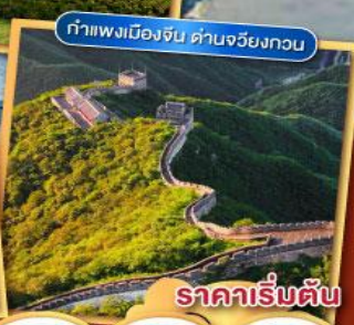
กำแพงเมืองจีน ด่านจวิ๋นกวอน