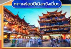
ตลาดร้อยปี ding hui miao