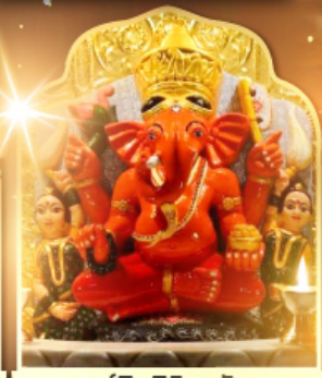
องค์สิทธินายก