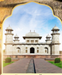
ถ้ำอาชันต้า