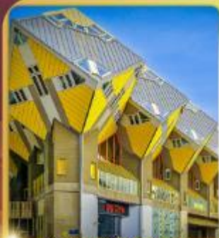
บ้านลูกเต๋า โคกคูนูส

“ล่องเรือหลังคากระจก” ชมกรุงอัมสเตอร์ดัม