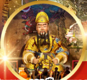
วัดแซกง 600 ปี หุ่นทอง