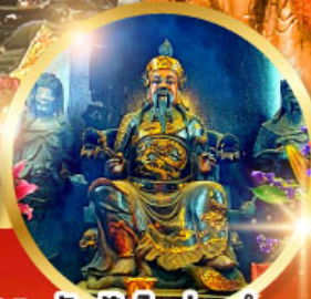
วัดปิกโตฮองอ่า