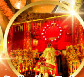
วัดเจ้าแม่กวนอิมฮองอ่า (สวนหนานเท่เลียน)