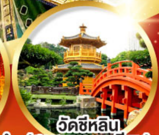
วัดซีหลิน