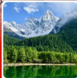
อุทยานπίงโกว