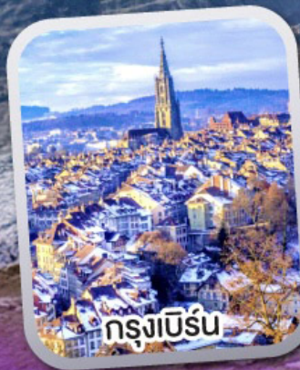
กรุงเบิร์น