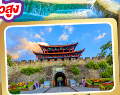
เมืองโบราณต้าหลี่