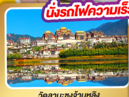
วัดลามะชงจ้านหลิง