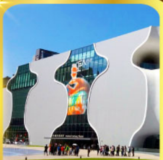
โรงละครแห่งชาติไทจง