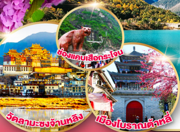
ช่องแคบเสื่อกระโจน