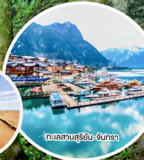
ทะเลสาบสุริยัน-จันทรา