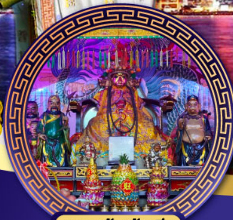
ศาลเจ้าหังเจีย