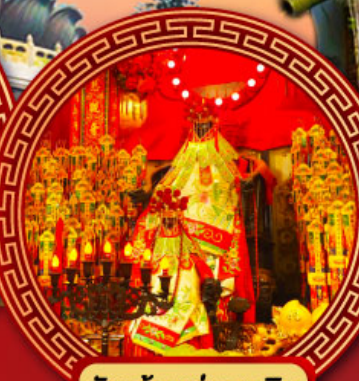
วัดเจ้าแม่กวนอิม ช่องฮ่า