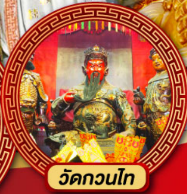
วัดกวนไท