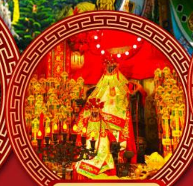
วัดเจ้าแม่กวนอิม ฮ่องกง