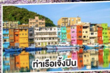
ท่าเรือเจ๋งป็น