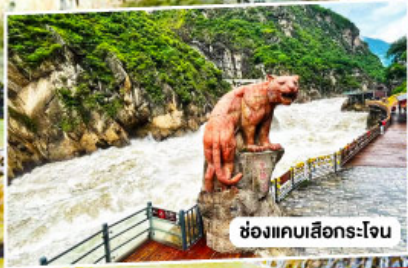
ช่องแคบเลิเออร์โจน