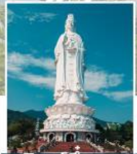
ลินห์อิ่ง